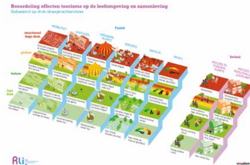
Raad voor de leefomgeving en infrastructuur. (2019). 'Waardevol toerisme, de leefomgeving verdient het'.